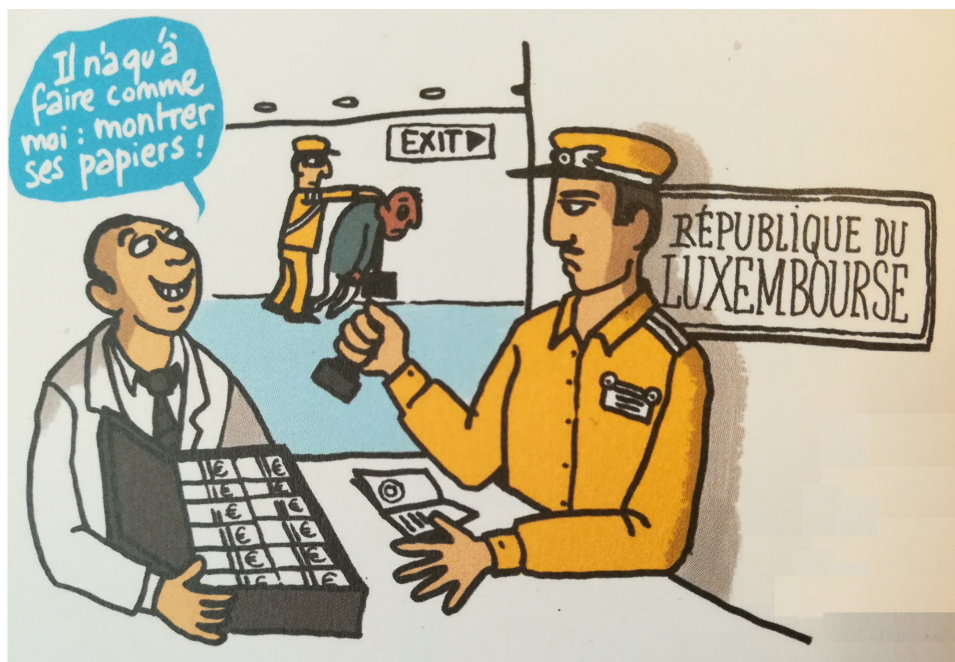
Illustration Claire Robert. Petit guide de survie "Répondre aux préjugés sur les migrations", Ritimo, édition 2017.