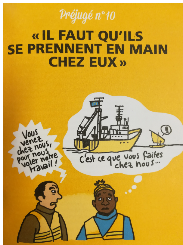
Illustration Claire Robert. Petit guide de survie "Répondre aux préjugés sur les migrations",

Chaque mois, des événements en solidarité avec les personnes migrantes sont proposés sur le site des états généraux des migrations.